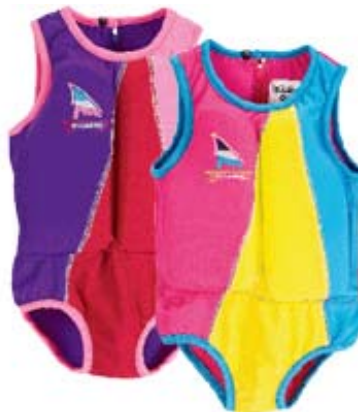
Girl's Swimsuit Sleeveless