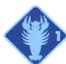
Grundlagentest 1 „Krebs“