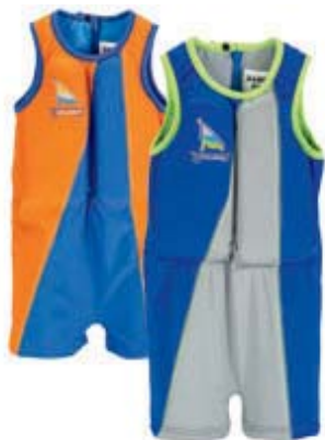
Boy's Swimsuit Sleeveless